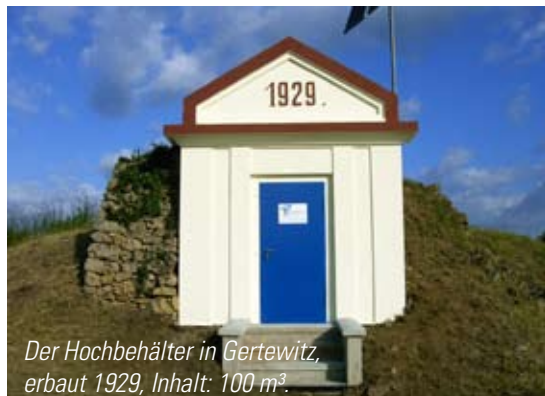
Der Hochbehälter in Gertewitz, erbaut 1929, Inhalt: 100 m 3 .

Die meisten Hochbehälter im heutigen Verbandsgebiet wurden um die vergangene Jahrhundertwende errichtet, der älteste am nördlichen Stadtrand Pößnecks gelegene Hochbehälter Rothig im Jahre 1897. Die versorgungstechnisch wichtigsten Wasserspeicher sind in den letzten Jahren saniert und auf den technisch neuesten Stand gebracht worden. Dafür investierte der Zweckverband, auch mit Hilfe umfangreicher Fördergelder des Landes Thüringen, seit 1990 über 2,7 Millionen Euro.