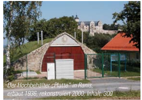
Der Hochbehälter „Platte“ in Ranis, erbaut 1936, rekonstruiert 2000; Inhalt: 300

Spaziergänger und Wanderer sehen sie oft: die teilweise sehr attraktiv gebauten Wasseranlagen am Rande, teilweise auch außerhalb der Ortschaften. Es sind die Bauwerke der Hochbehälter für unser Trinkwasser. Hochbehälter sind Wasserspeicher. Sie sind notwendig, weil der Wasserbedarf der Bevölkerung und der Industrie starken zeitlichen Schwankungen unterliegt. Mit diesen Vorräten ist es möglich, dass jederzeit genug Wasser bereitgestellt werden kann. Diese Wasservorräte dürfen allerdings nicht zu groß sein, damit dort immer nur wirklich frisches Wasser