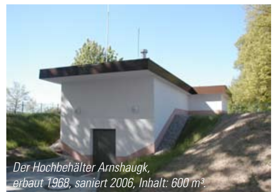
Der Hochbehälter Arnshaugk, erbaut 1968, saniert 2006, Inhalt: 600 m 3 .