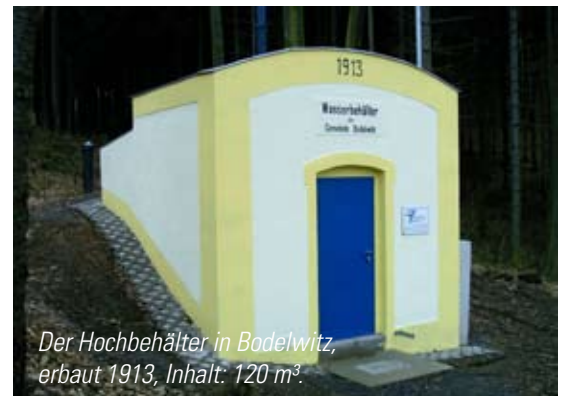
Der Hochbehälter in Bodelwitz, erbaut 1913, Inhalt: 120 m 3 .