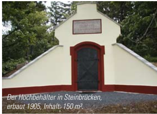
Der Hochbehälter in Steinbrücken, erbaut 1905, Inhalt: 150 m 3 .