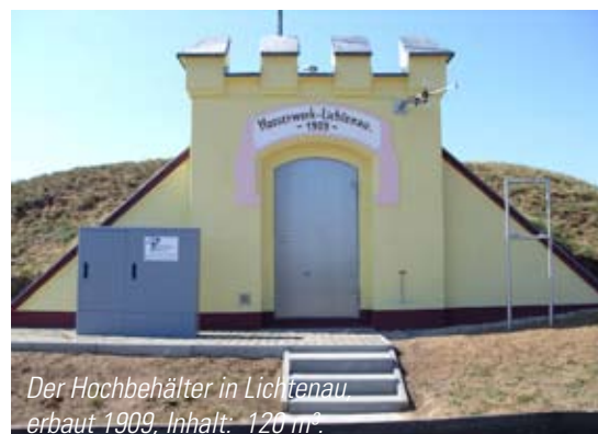
Der Hochbehälter in Lichtenau, erbaut 1909, Inhalt: 120 m 3 .